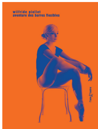
Aventure des Barres flexibles 176 p. ill. – 17,50 € – 15 x 20 cm