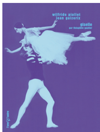
Giselle 32 p. ill. – 6,00 € – 15 x 20 cm