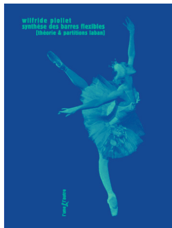
Synthèse des Barres flexibles [théorie et partitions laban] 416 p. ill. – 32,50 € – 15 x 20 cm